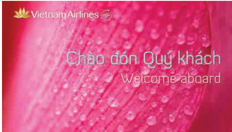
WELCOME SCREEN MÀN HÌNH XIN CHÀO