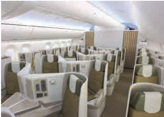
BUSINESS CLASS HẠNG THƯƠNG GIA