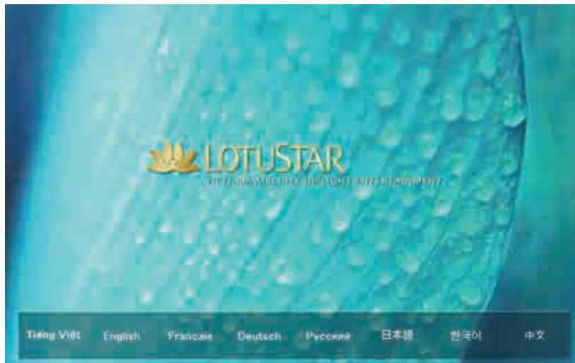
IFE GUI HOME SCREEN TRANG CHỦ MÀN HÌNH GIẢI TRÍ