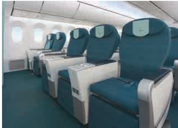
PREMIUM ECONOMY CLASS HẠNG PHỔ THÔNG ĐẶC BIỆT